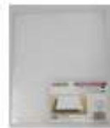
ブレードパッド (A4用と20cm角用の2種類があります)