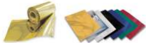
フォイル(箔)各種 ユニバーサルタイプのロール箔(180mmx122m)と枚葉のケイック&イーザーフォイル(13x21cmと9x18cmの2種類)があります。