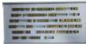
フォントセット各種 (フォントコンテナに収納) 写真はNation Master Package Latin GB 5.5mm Standardあ(フォントサイズに応じてオプションのフレームが必要です)