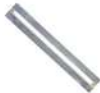
ロングフレーム1L5 (5.5mmフォント1列)