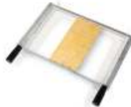
真ちゅう製マトリックス (彫刻をしてマスターフレームにセットします)