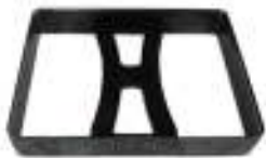
カッティングブレード ハードカバーの窓加工ができます。 写真は80 x 110mmのもの (オプションのカッティングブレードパッドを同時にご使用ください)