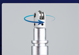
自動調整ロータリーアクション