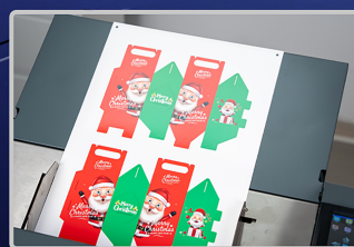
フィルムラミネート厚紙対応