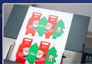
フィルムラミネート厚紙対応