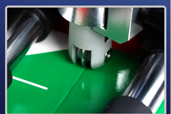
深くてスムーズな筋押し